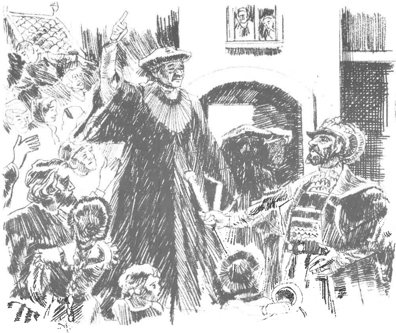
Luther verkondigde het Woord Gods

komst, vrede voor zijn ziel. Wat hij nergens en bij niemand had kunnen vinden, dat vond hij bij Christus in het Evangelie. Ogenschijnlijk was het een louter exegetische ontdekking die hij opdeed aan Romeinen 1 : 17, waar gesproken wordt over de rechtvaardigheid Gods die in het Evangelie geopenbaard is, uit geloof tot geloof —, in werkelijkheid was het veel meer dan dat. Hoe hoog aangeschreven kwam nu dat Woord Gods bij hem te staan. Het werd de bron waaruit hij leefde. En het bleef dat ook. Doctor der H. Schrift te zijn werd Luther de hoogste eer, de titel waarop hij zich meermalen in de hitte van de strijd heeft beroepen, niet om het karakter der geleerdheid dat er aan eigen is, maar omdat hij zich geroepen wist niets dan dat Woord te moeten doceren —, doctor komt van doceren .