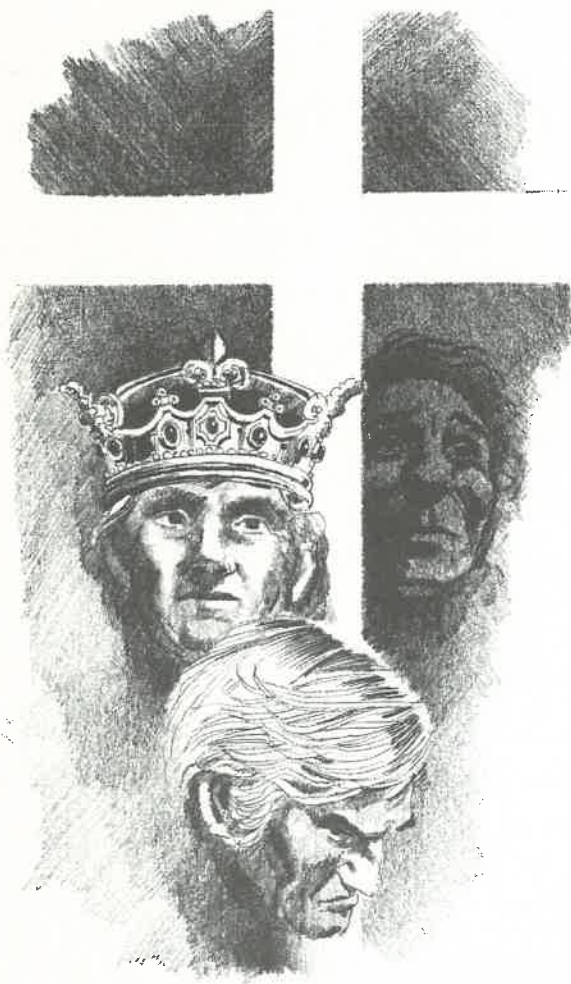
Zonde blijft, maar zal niet meer regeren.

Evenmin mogen we Rom. 7 lezen alsof het een beschrijving geeft van een gelovige die vervalt in openlijke moedwillige overtreding van Gods gebod. Jammer genoeg is het bijbelgedeelte maar al te vaak zo uitgelegd en heeft het een pessimistische, verslagen kijk op het leven veroorzaakt. In plaats van God te dienen met de toegewijde ijver van Paulus;