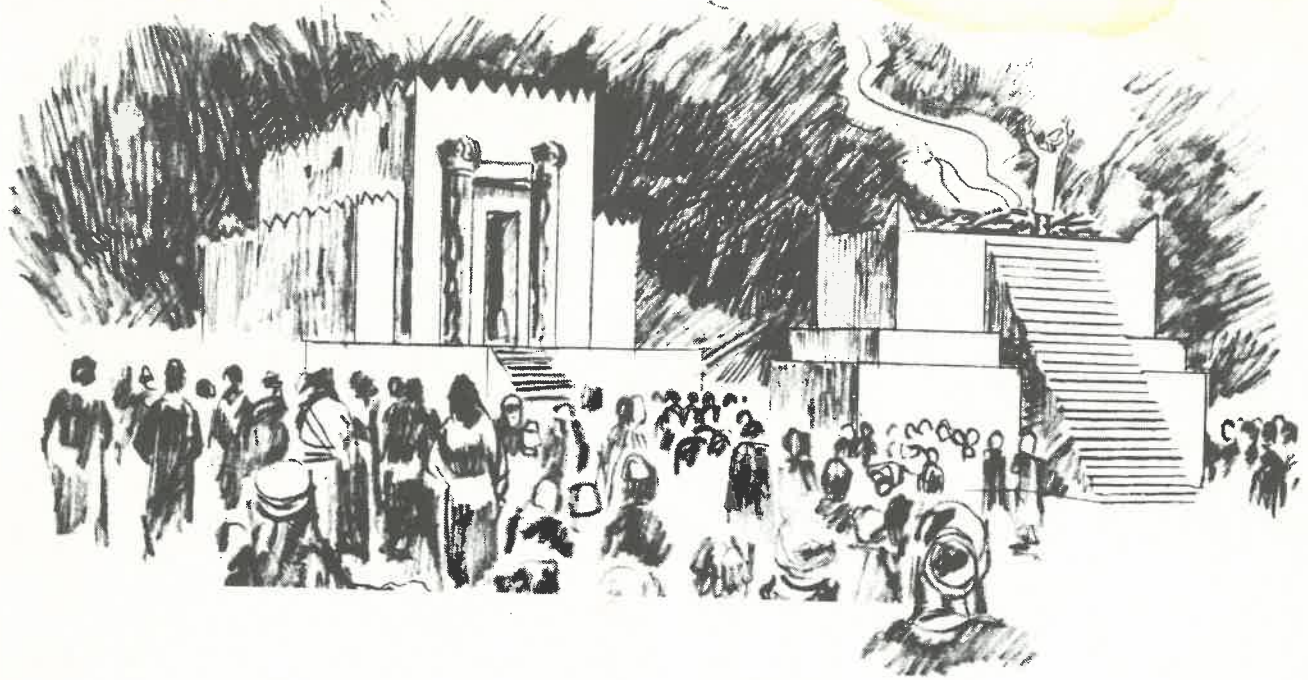
Nadat de hogepriester op de grote verzoendag het offer had gebracht, kwam hij uit het heiligdom om het volk te zegenen.

gebeurtenissen van eschatologische betekenis en dient daarom ook te worden gezien in verband met de wederkomst van Jezus Christus.