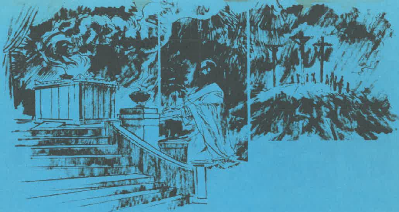
In het leven en lijden van Jezus Christus oordeelde God de wereld en de zonde en schonk Hij rechtvaardiging aan allen die in Hem geloven.

een spiegel van het verleden, maar ook van de toekomst. In de dood en de opstanding van Jezus zien we het uitgieten van de toorn van God, het ware karakter van de hel, het rechtvaardig oordeel van God, de grote verzoendag, de opstanding van de gelovigen, de nederlaag van de boze, de overwinning op zonde en dood en het geschenk van het eeuwige leven in heerlijkheid.